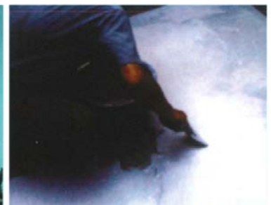
受水槽内の補修施工例

海中や淡水中の鋼管杭・栈橋・鋼板・海洋構造物等港湾設備の海中部分やダム・用水路・水門等の設水部分の防食処理が出来ます。