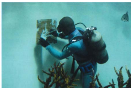
水族館水槽内防水塗装補修施工例