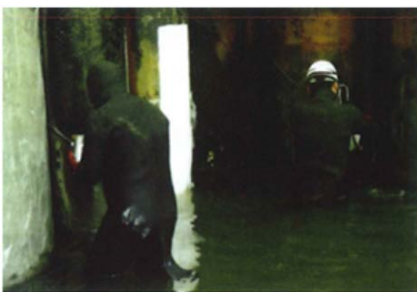
鋼管杭 防食補修施工例

2つの液剤を混ぜ、ゴムヘラなどでしごくように 塗布するだけで、乾燥した場所と同じように作業が出来ます。